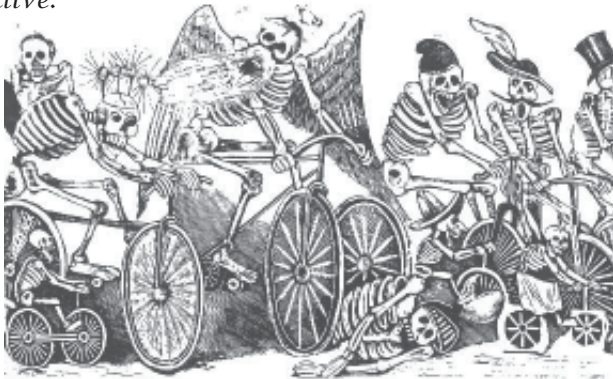
LEFT: Jose Guadalupe Posada

During this mystical celebration bells toll throughout the night until dawn. Here death is not feared but embraced and guided by the return of generations where the faithful challenge the dead with the ancient knowledge that the past is alive.