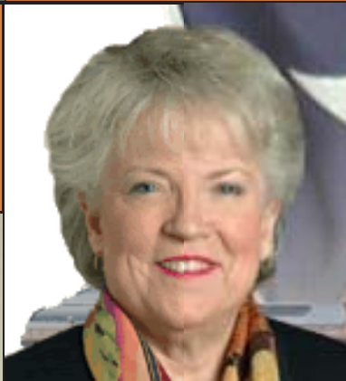
Carol Keeton Strayhorn